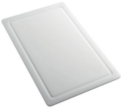
Tabla de corte de HPDE 8657 001