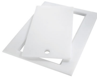
Tabla de corte Twin in HDPE 8644 101