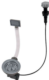
Desagüe automático Gun metal - PG 8407 110