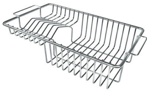
Cesta portaplatos inox 8100 201